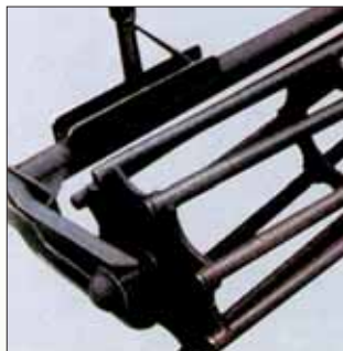
Rullo a gabbia. Cage roller. Rouleau en forme de cage. Stabwalze.