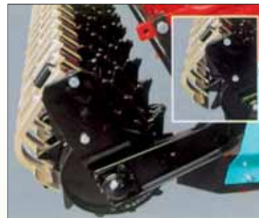
Rullo paker/ Raschiatore regolabile. Paker roller/ Adjustable scraper. Rouleau paker/ Racloir réglable. Paker-Walze/einstellbarer Schaber.