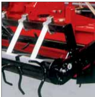
Rullo a spuntoni. Spike roller. Rouleau à pointes. Zinkenwalze.